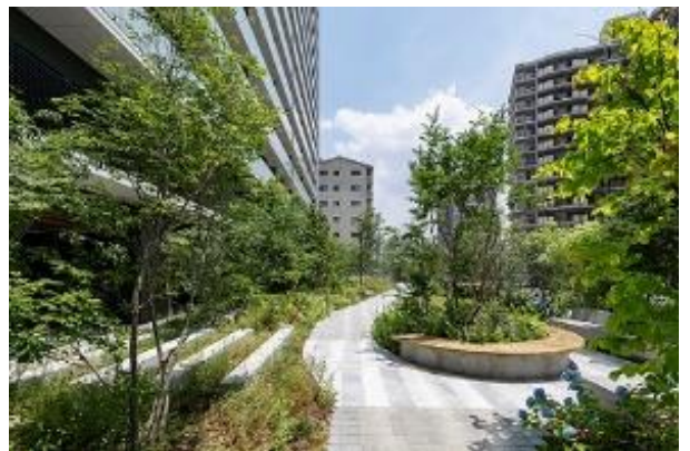
敷地南側公開空地