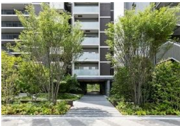
敷地北側アプローチ

幹線道路に面した北側を雑木木立と低木混植による緩衝緑地を形成しつつ、緑の木立をくぐり抜けた先の静かな癒しの空間や、南側公開空地の日当たりの良さを生かした子供から大人までもがくつろげる、明るく開放的な空間づくりが高く評価されました。